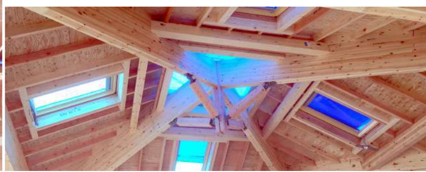
平屋建 建築面積320㎡【NK工法】 六甲山中に建つ保養所。リビングは八角形平面80㎡(直径11m)に4本の登り梁を架けた構造。

ただ今設計中 保育園 大阪府富田林市 1,100㎡ 高齢者住宅 京都市山科区 1,400㎡ 児童福祉施設 長野県木曾郡 1,134㎡ 他