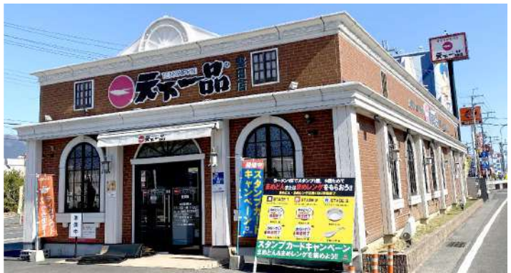
平屋建 建築面積180㎡【NK工法】 幹線道路沿いに建つ店舗。15m×6mの客席に柱無し。 梁や小屋組や火打が、内装として活かされ、洒落た室内を演出しています。