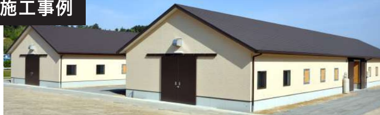
平屋建 建築面積380㎡【NK工法】栗東の厩舎 鉄骨よりもスリムで、工期が短く、仕上げが楽にできる、木造軸組の長所を活かしています。