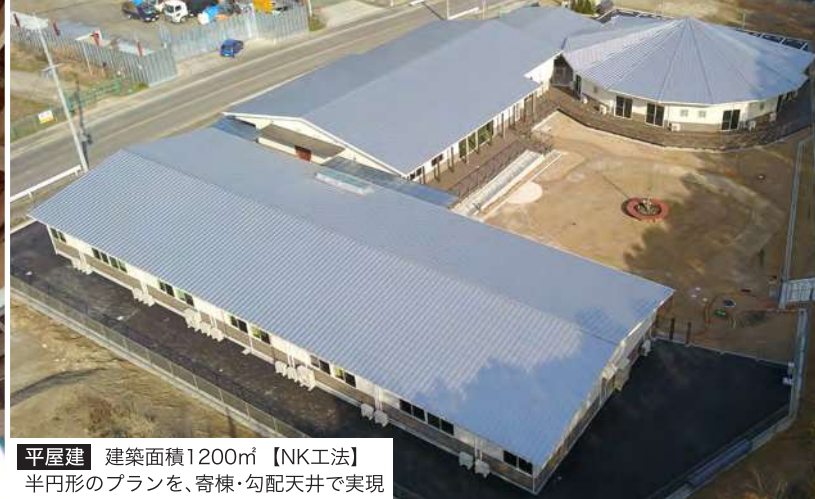
平屋建 建築面積1200㎡【NK工法】 半円形のプランを、寄棟・勾配天井で実現