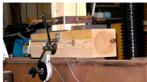
【柱脚金物引張試験】