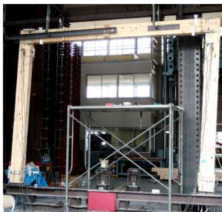
【門型ラーメンせん断耐力試験】

お客様プランの安心と安全を実現するために木質ラーメン構造、狭小耐力壁、トラス構造などを駆使して、求められる耐震性と実用性を兼ね備えた構造を提案いたします。