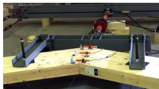
【棟部剛接合長期荷重試験】